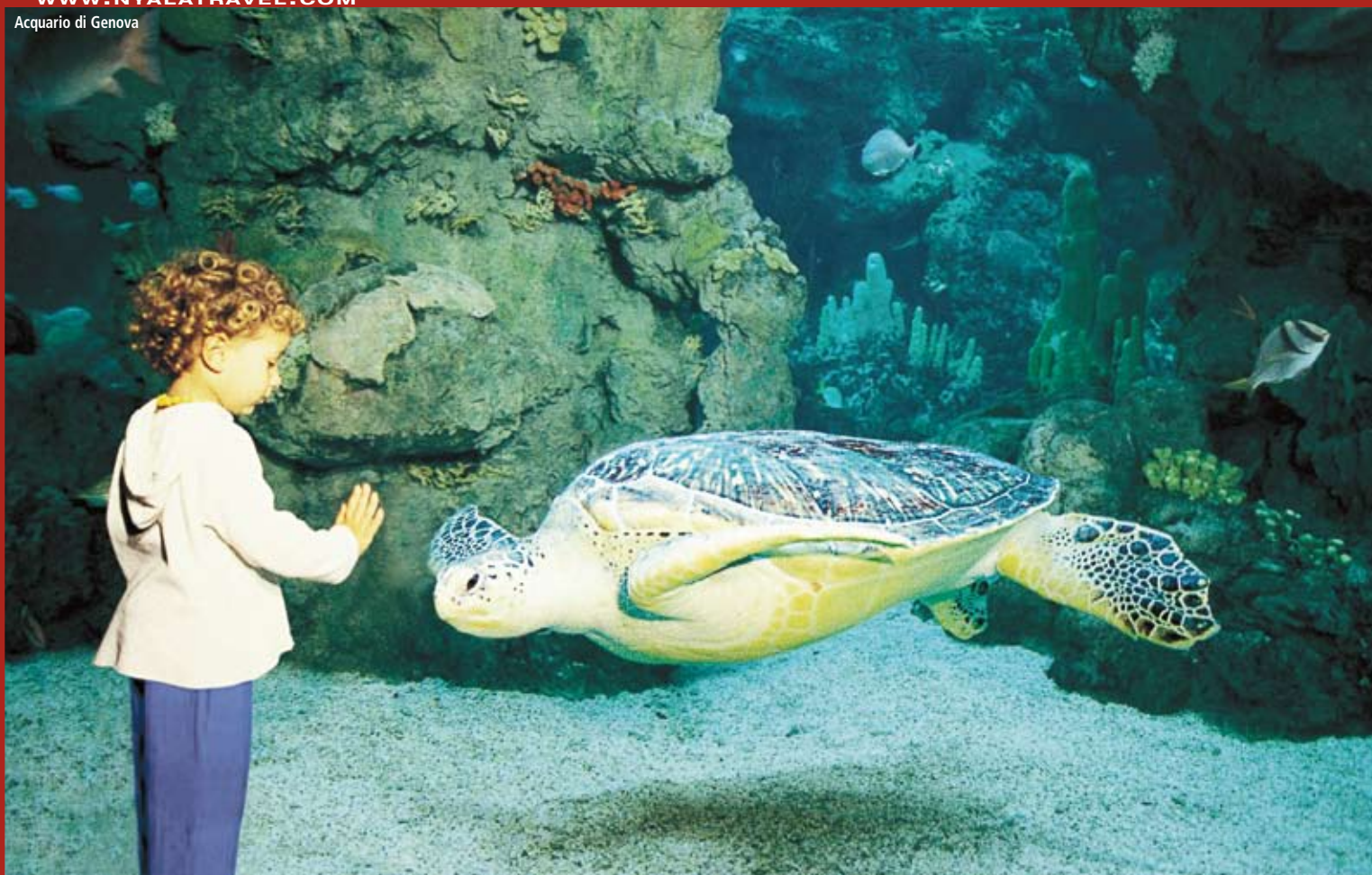
Genova. Padiglione del mare e della navigazione