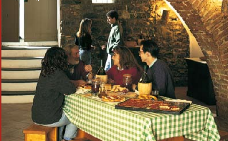
Cantina tipica ligure