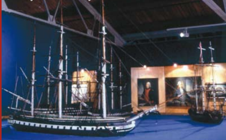
Genova. Porto antico