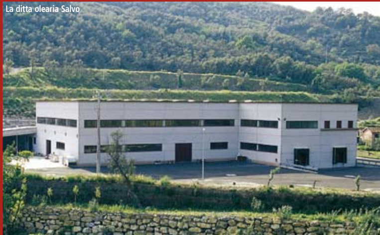
La ditta olearia Salvo